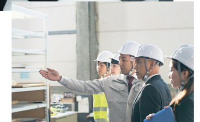
審査機関による現地審査